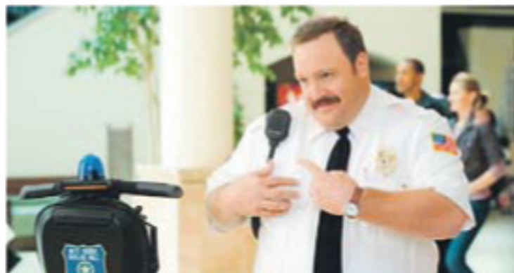
In Paul, dem Kaufhaus Cop, schlummert ein verkannter Polizist.